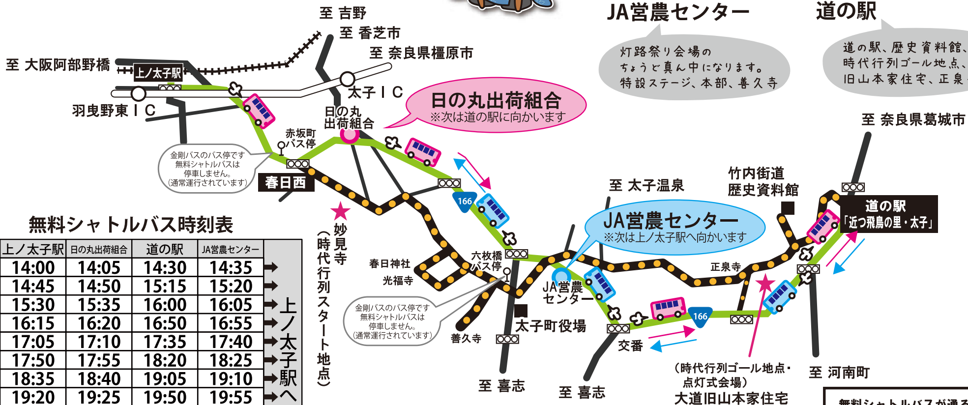
無料シャトルバス時刻表